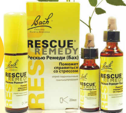
АСР-004948/07; АСР-002089/08. РЕКЛАМА

Информация о скидках и акциях на сайте: www.bfr.ru и по телефонам: +7 (495) 699-57-38; +7 (495) 504-90-44; 8 (800) 505-65-07 (Бесплатный звонок по России)